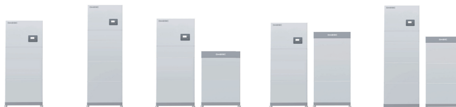
SCHÉMA DU SYSTÈME